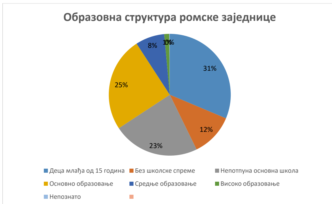
Графикон 1: Образовна структура ромске заједнице града Зајечара ( http://www.inkluzijaroma.stat.gov.rs/sr/зајечар )